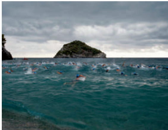
TOUCH-THE-ISLAND #2 start | september 2012